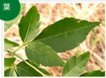
食品素材のセンダン葉