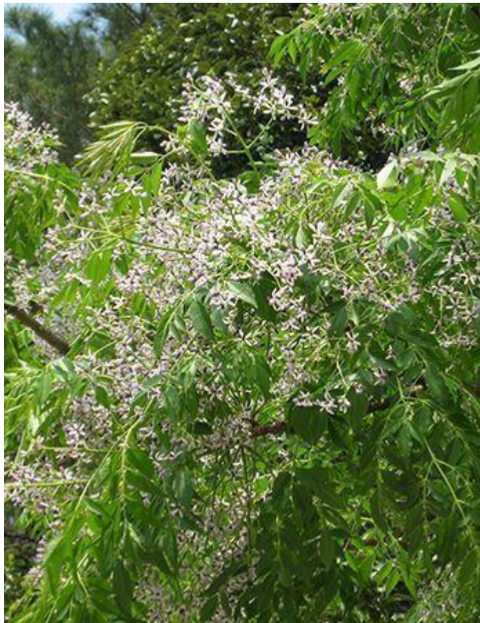
沖縄のやんばるに自生しているセンダン＝本島北部

名護市の生物資源研究所などがセンダンが39種類のがん細胞に効くことを実証した論文「亜熱帯における沖縄諸島のセンダンの葉の成分によるガンに対する効能」が18日までに、米国のがん研究に関する学術誌「American Journal of Cancer Research」に掲載された。