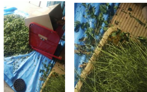
葉柄から葉を分離